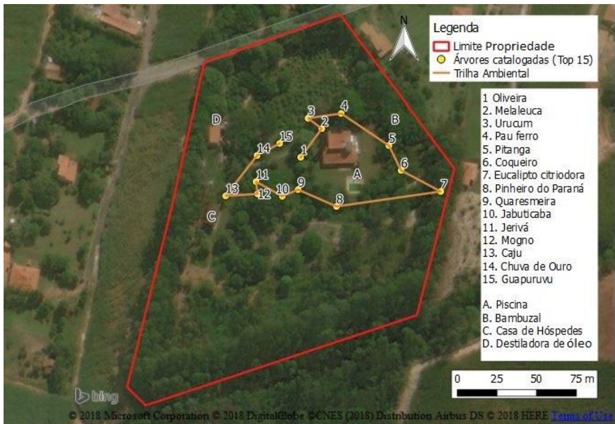
Figura 3. Possibilidade de trilha ambiental, percorrendo 15 espécies de árvores. Em A, localização da piscina, B bambuzal, C casa de hóspedes e D destiladora de óleo

A Figura 3 mostra a distribuição espacial dessas espécies na propriedade, a qual também dispõe, conforme Figura 4, de outros pontos com potencialidades recreativas: piscina, área de piquenique (bambuzal), casa de hóspedes e destiladora de óleo. É importante destacar que a casa de hóspedes, construída por volta de 1990, era utilizada pela família que, devido a questões de logística, mudaram-se para o centro da cidade, encontrando-se, portanto, inabitada, mas que pode tornar-se um local potencial para o desenvolvimento de atividades turísticas.