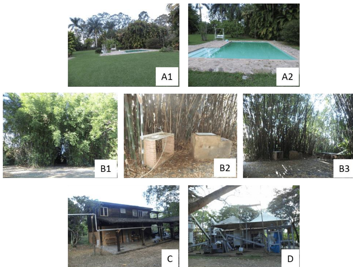
Figura 4. Os pontos indicados: A piscina, B bambuzal, C casa de hóspedes e D destiladora de óleo